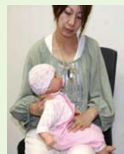
首が不安定な場合は、子どもの首から肩にかけて持ち、他方の手でお腹をかくく押さえるようにします。