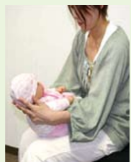
子どもの頭と背中を包み込むようにして、向かい合います。