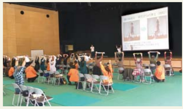
座りできるストレッチの指導