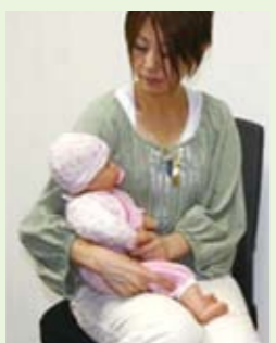
子どものお尻から足を抱えて、ママのお膝に座らせます。