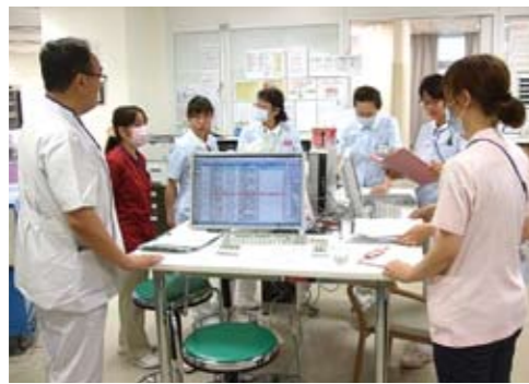
(写真掲載はご本人の承諾済み)

シームレスな医療を提供し、状態が安定されたら地域のかかりつけ医に紹介するという役割を果たしている病院です。回復期リハビリテーション病棟は56床で、約7割が整形疾患（大腿骨近位骨折、脊椎圧迫骨折など）、3割が脳血管疾患（脳梗塞、脳出血など）、1割未満で廃用症候群の患者さんが入棟されています。チーム医療を重視し、回診やカンファレンスなど多職種が一堂に会し、患者さんの状態や環境についての情報共有する機会を多くとっています。