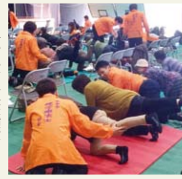
分かりやすく丁寧な指導を心がけています!

参加者からは「痛みに着目したテーマでとても良かった」「分かりやすく丁寧で良かった」「家事の合間とかテレビを見ながらやってみます」「またやってほしい」などありがたいお言葉をたくさん頂戴しました。講座終了後も、多くの方にご質問をいただき、皆さんの関心の高さが伺われました。 今後当協会は理学療法士の専門性を活かし、県民の皆さんのお力になれるようなイベントを開催していきたいと思っております!