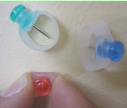
抜くとき簡単、安全

カバーごと押し込むと普通の画びょうと同じように刺さり、抜くときはカバーの部分をつまむと軽い力でらくに抜けます。七色ミックスの10個入り。鮮やかな色で、使い分けにも便利です。