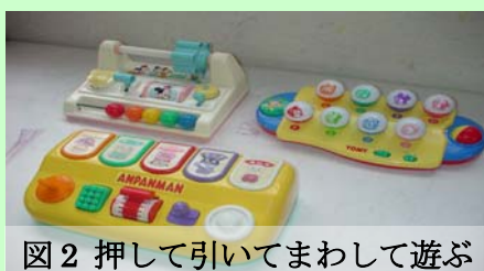
図2 押して引いてまわして遊ぶ