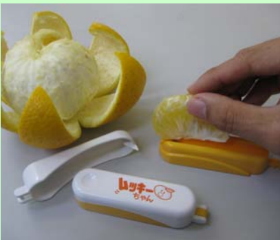
ミカンの皮むき簡単に

まず白い上蓋と黄色のカッターに分けます。上蓋のプラスチックの爪を皮に刺し、ゆっくり引くと切れ目が入ります。その後、房をばらして黄色い力ツターの刃にセットし、スライドさせると薄皮にきれいに切れ目が入ります。後は薄皮をむいて口に入れるだけ。牛乳パックを開いたり、切り口のない袋を開封したりするときにもカッターやはさみ代わりに使えます。