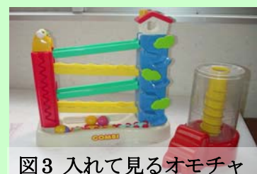
図3 入れて見るおもちゃ